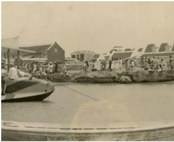
Aki ta dilanti di Gezaghheberskantoor na Aruba